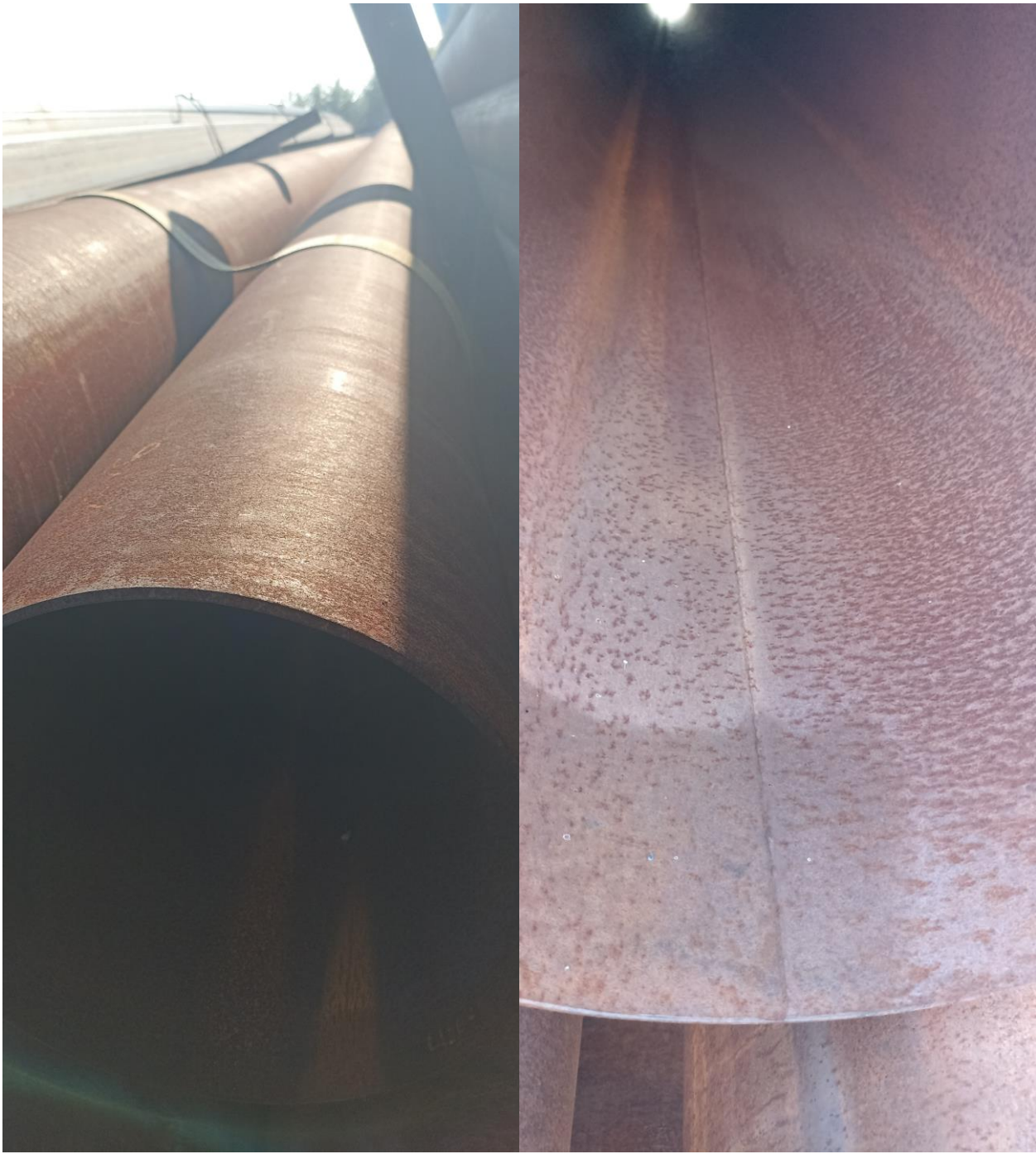
Труба 426*6*12000-МД ГОСТ 10704-91-20 ГОСТ 10705-80 (ТЭМПО) – 2,984т