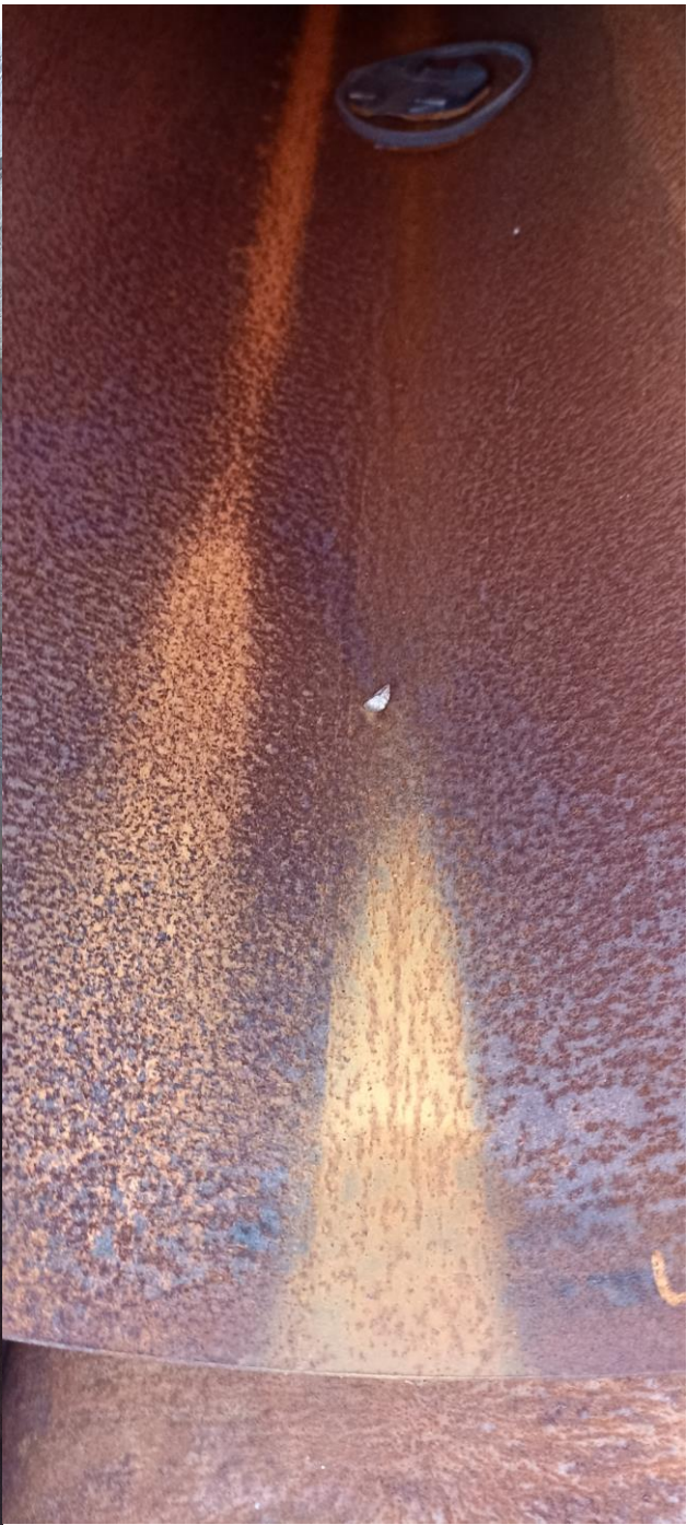
Труба 426*6*12000-МД ГОСТ 10704-91-20 ГОСТ 10705-80 (ТЭМПО) – 2,984т