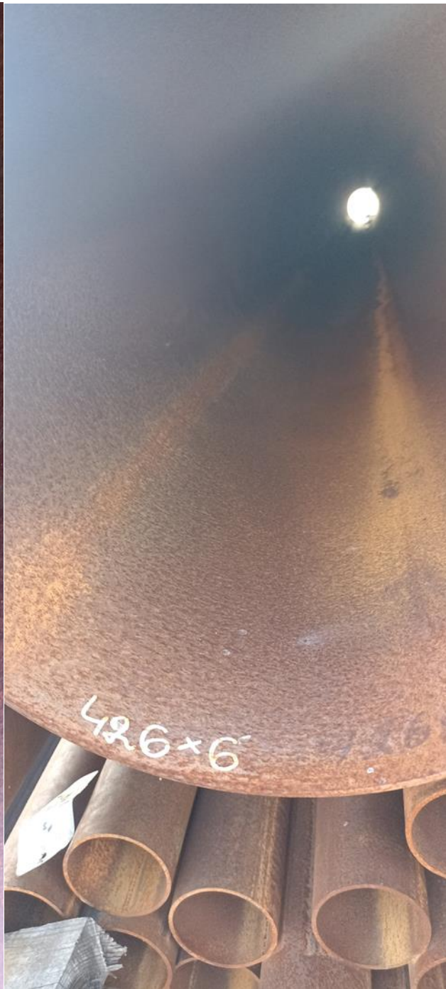
Труба 426*6*12000-МД ГОСТ 10704-91-20 ГОСТ 10705-80 (ТЭМПО) – 2,984т