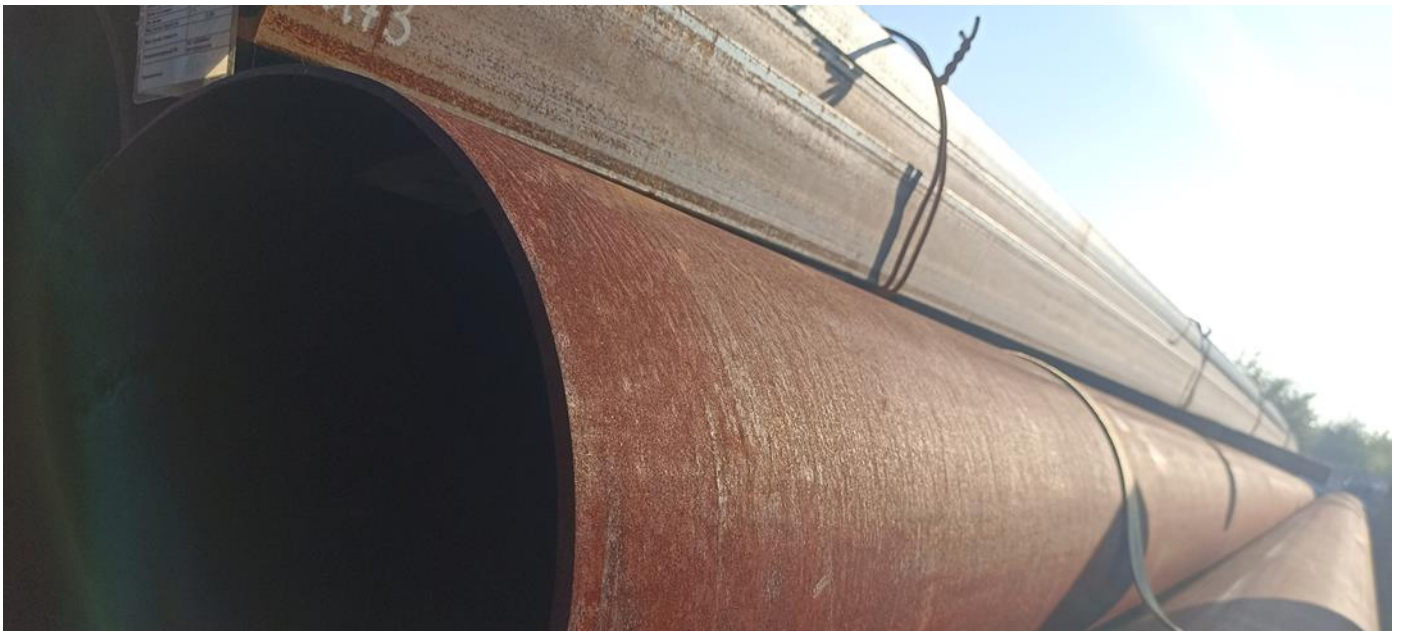
Труба 426*6*12000-МД ГОСТ 10704-91-20 ГОСТ 10705-80 (ТЭМПО) – 2,984т