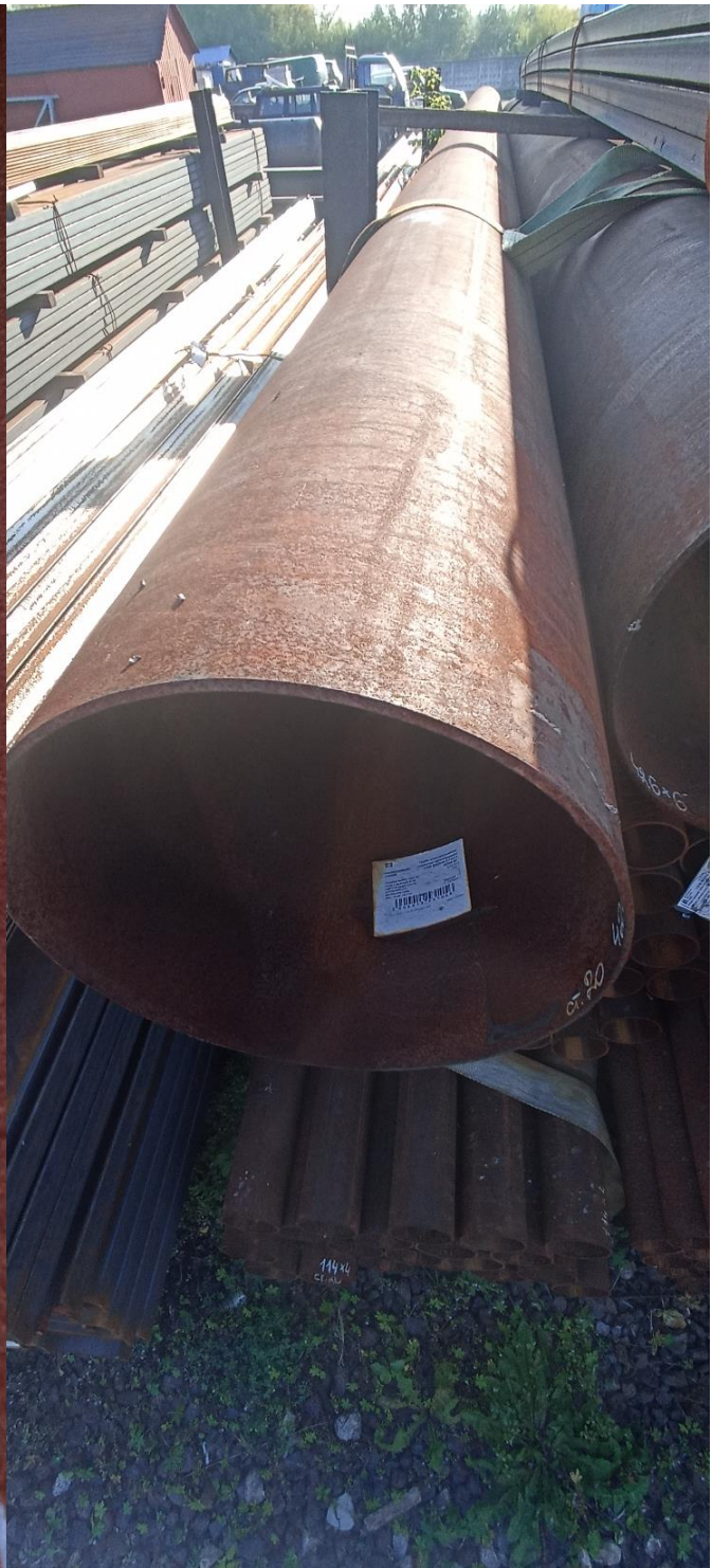
Труба 426*6*12000-МД ГОСТ 10704-91-20 ГОСТ 10705-80 (ТЭМПО) – 2,984т