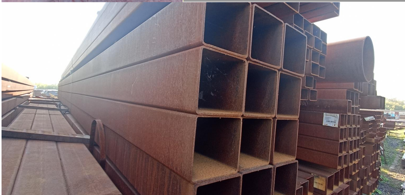
Труба профильная 180*180*6*12000-МД-09Г2С-15 ГОСТ 30245-2003,ГОСТ 19281-2014 (ТЭМПО) – 7.691т