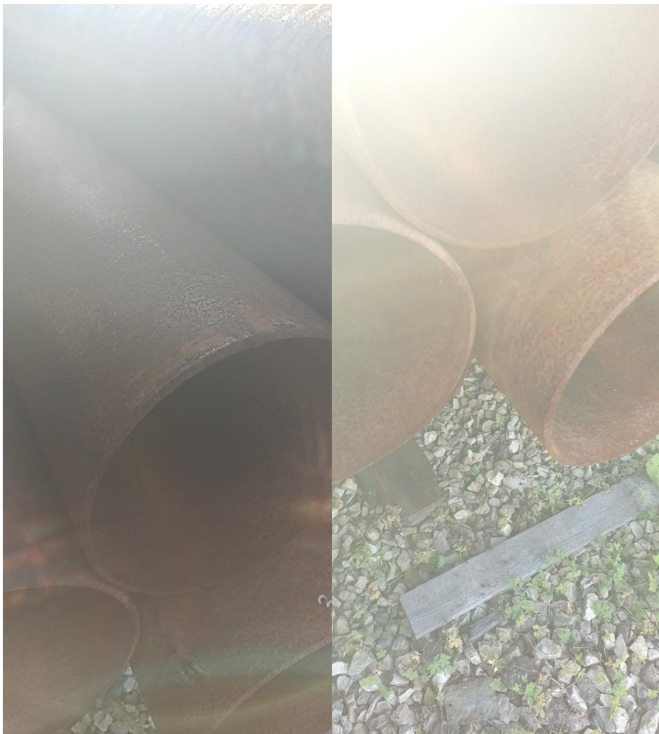
Труба 325*8*12000-МД ГОСТ 10704-91-20 ГОСТ 10705-80 (ТЭМПО)- 13.5т