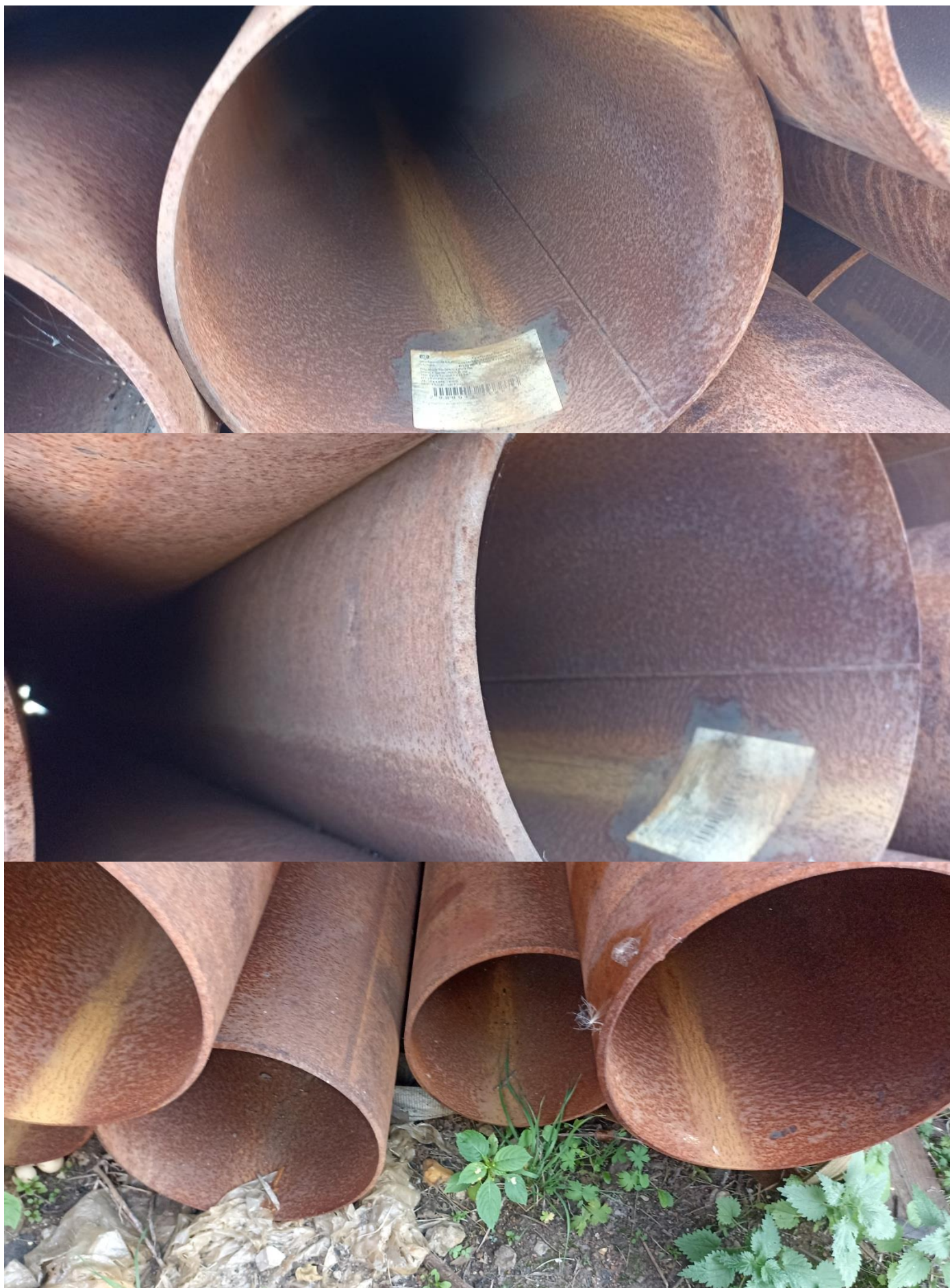
Труба 325*8*12000-МД ГОСТ 10704-91-20 ГОСТ 10705-80 (ТЭМПО)- 13.5т