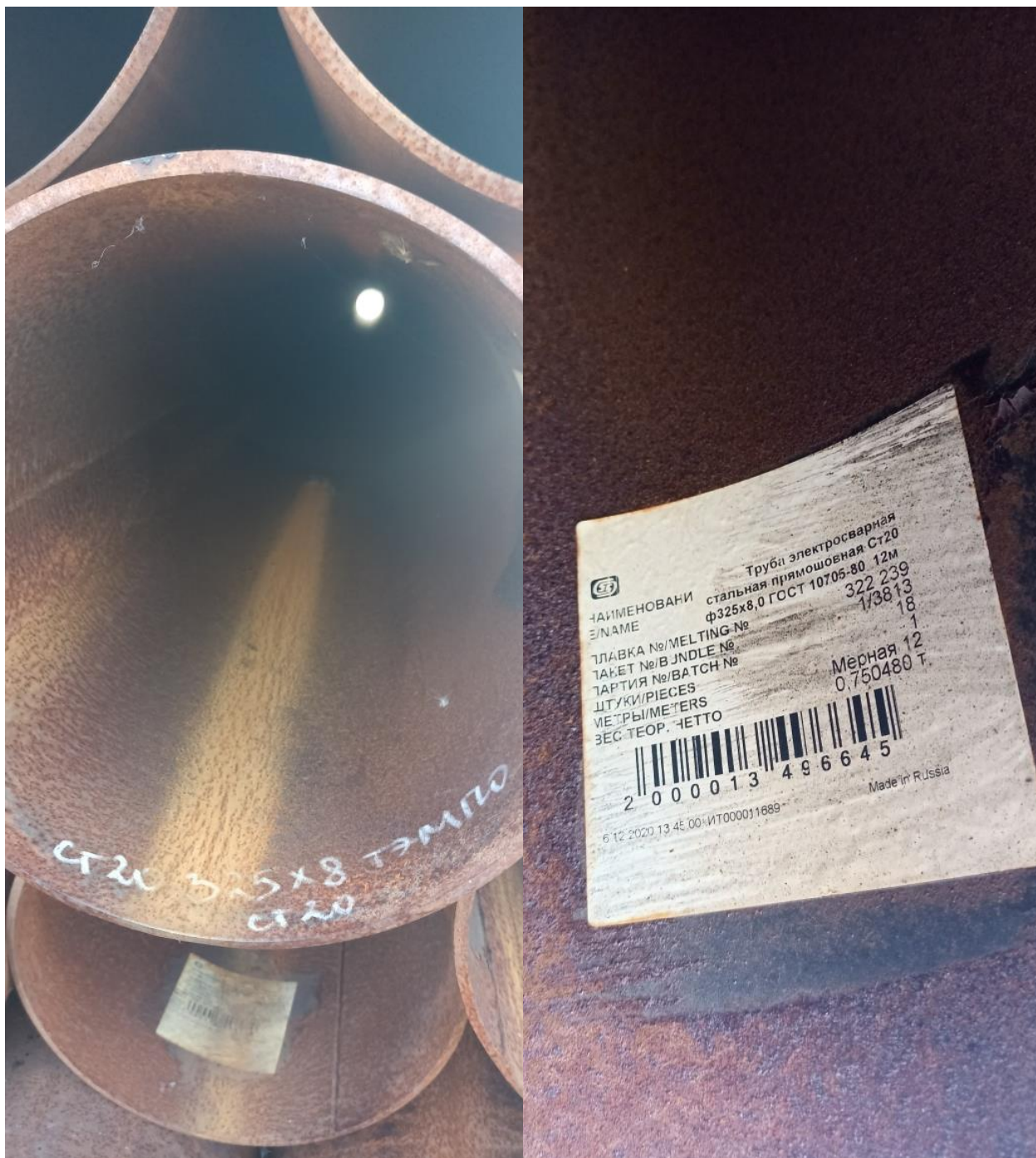
Труба 325*8*12000-МД ГОСТ 10704-91-20 ГОСТ 10705-80 (ТЭМПО)- 13.5т