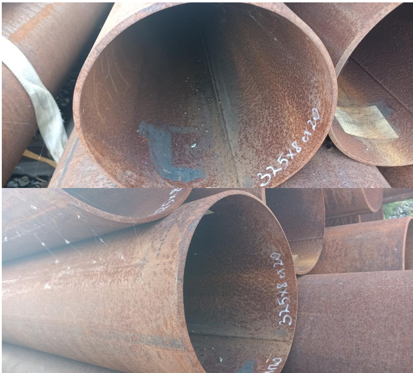
Труба 325*8*12000-МД ГОСТ 10704-91-20 ГОСТ 10705-80 (ТЭМПО)- 13.5т