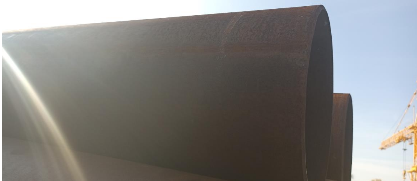
Труба 325*8*12000-МД ГОСТ 10704-91-20 ГОСТ 10705-80 (ТЭМПО)- 13.5т