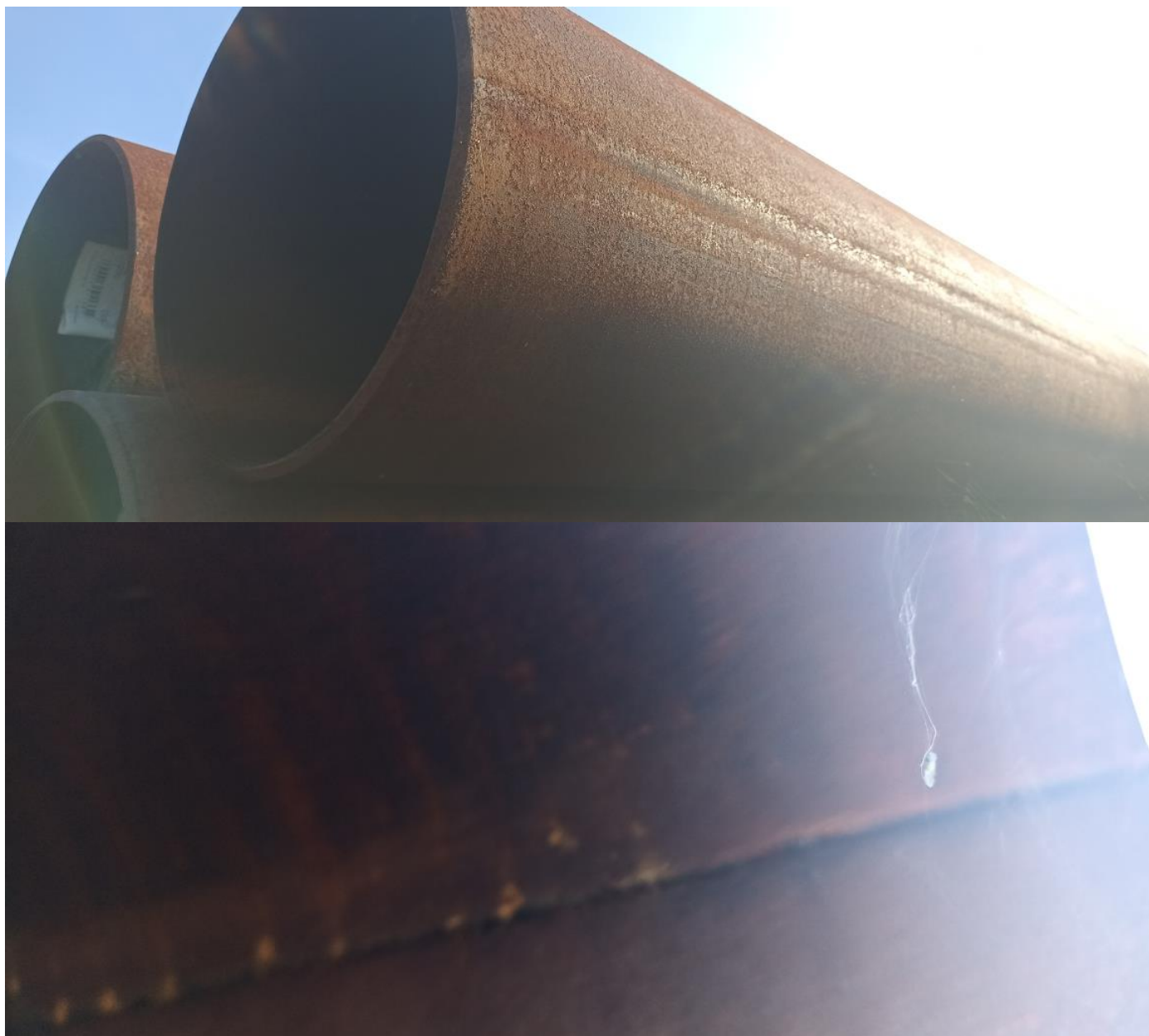
Труба 325*8*12000-МД ГОСТ 10704-91-20 ГОСТ 10705-80 (ТЭМПО)- 13.5т