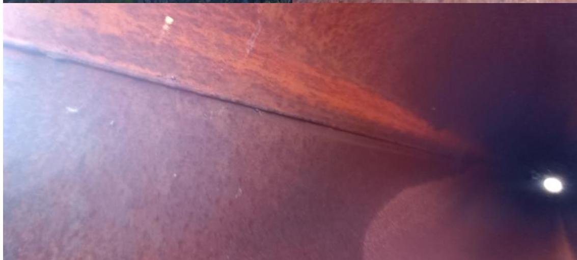
Труба 325*8*12000-МД ГОСТ 10704-91-20 ГОСТ 10705-80 (ТЭМПО)- 13.5т