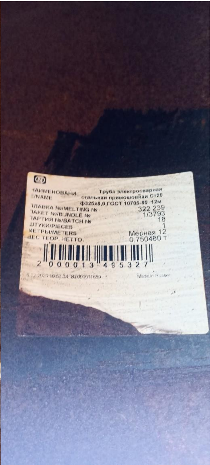
Труба 325*8*12000-МД ГОСТ 10704-91-20 ГОСТ 10705-80 (ТЭМПО)- 13.5т