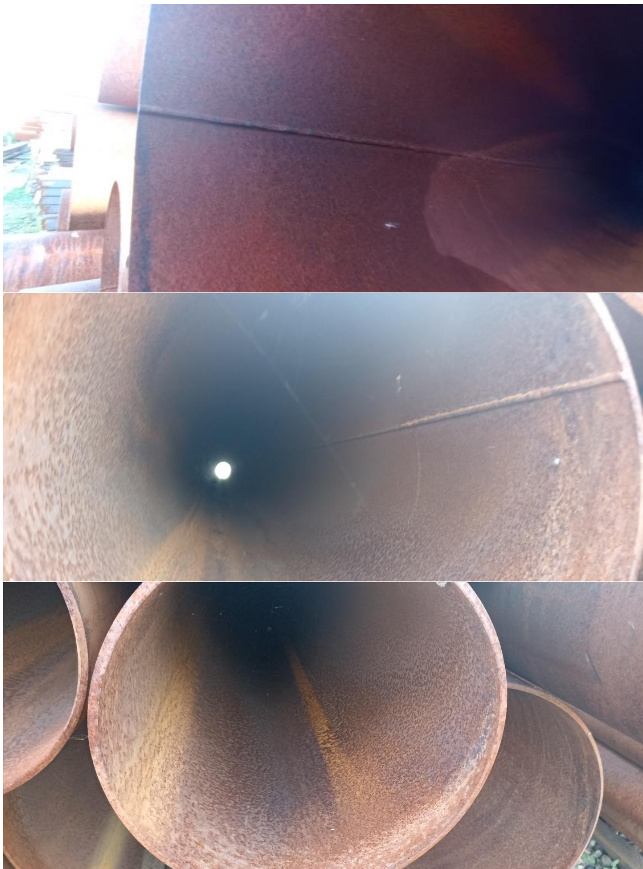
Труба 325*8*12000-МД ГОСТ 10704-91-20 ГОСТ 10705-80 (ТЭМПО)- 13.5т