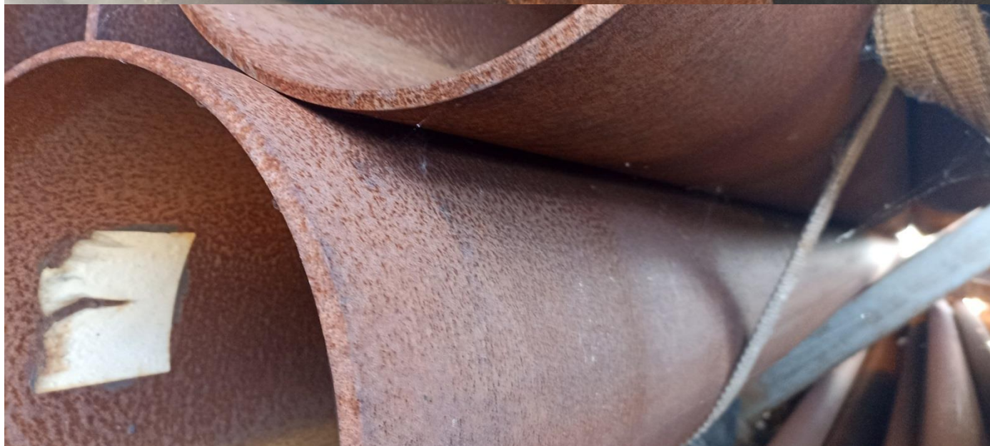
Труба 325*8*12000-МД ГОСТ 10704-91-20 ГОСТ 10705-80 (ТЭМПО)- 13.5т