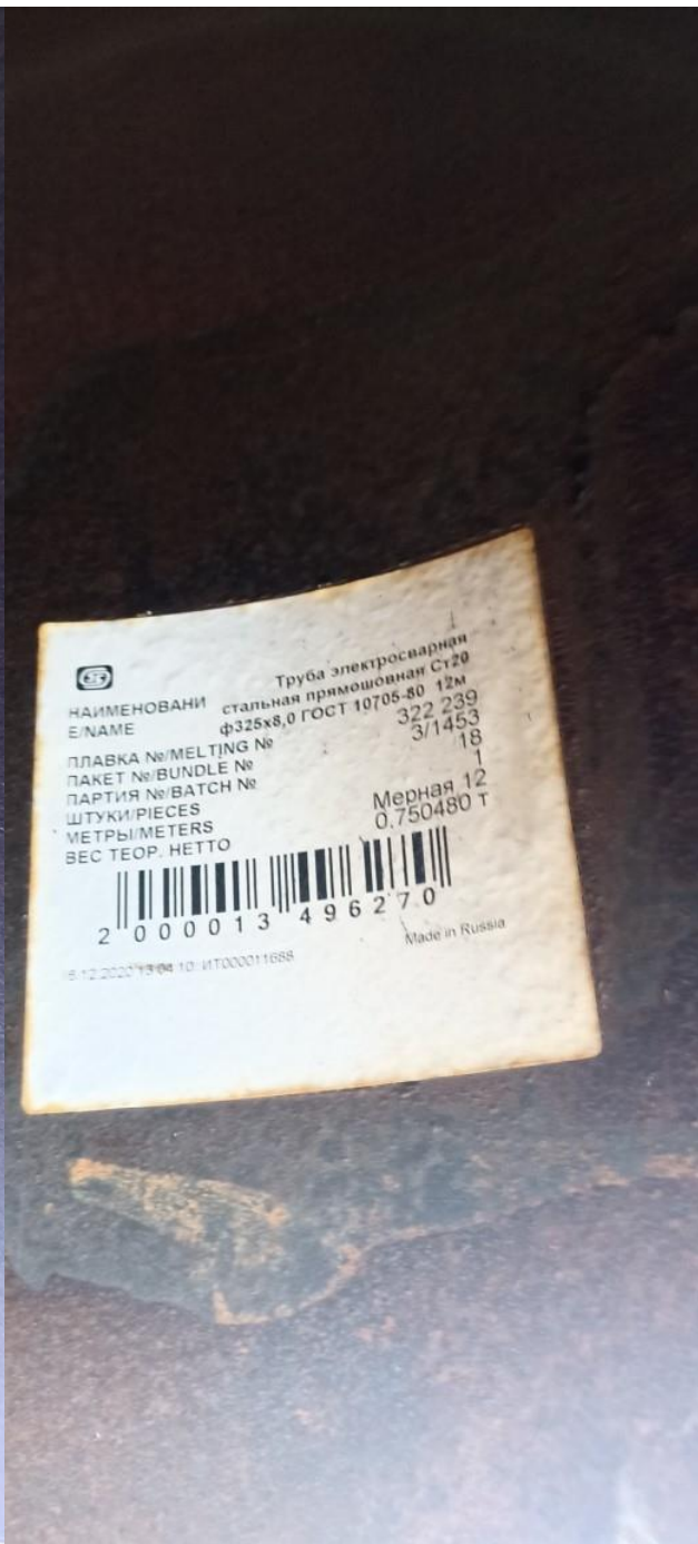
Труба 325*8*12000-МД ГОСТ 10704-91-20 ГОСТ 10705-80 (ТЭМПО)- 13.5т