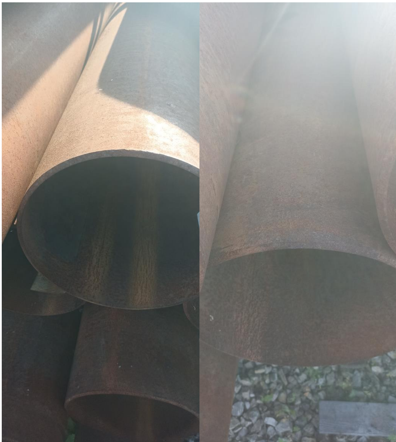
Труба 325*8*12000-МД ГОСТ 10704-91-20 ГОСТ 10705-80 (ТЭМПО)- 13.5т