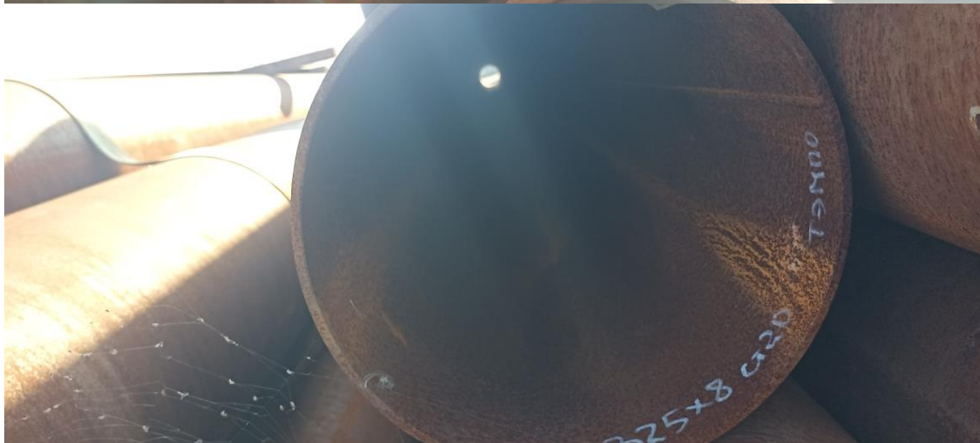
Труба 325*8*12000-МД ГОСТ 10704-91-20 ГОСТ 10705-80 (ТЭМПО)- 13.5т