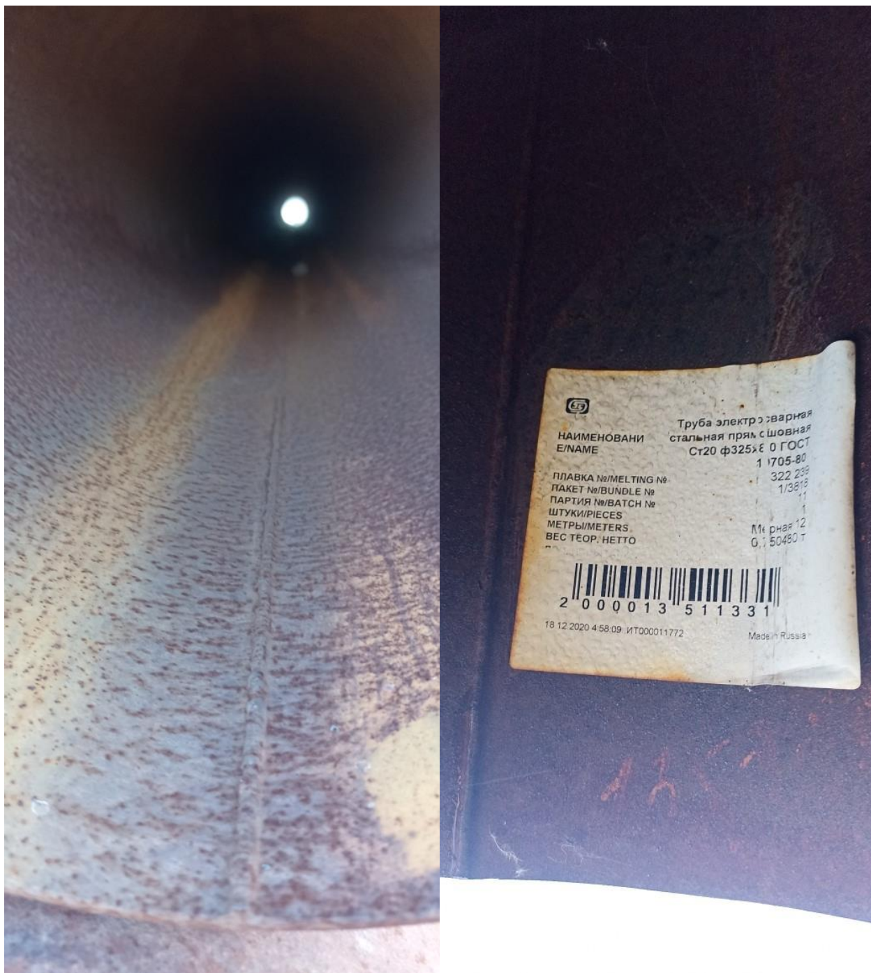
Труба 325*8*12000-МД ГОСТ 10704-91-20 ГОСТ 10705-80 (ТЭМПО)- 13.5т