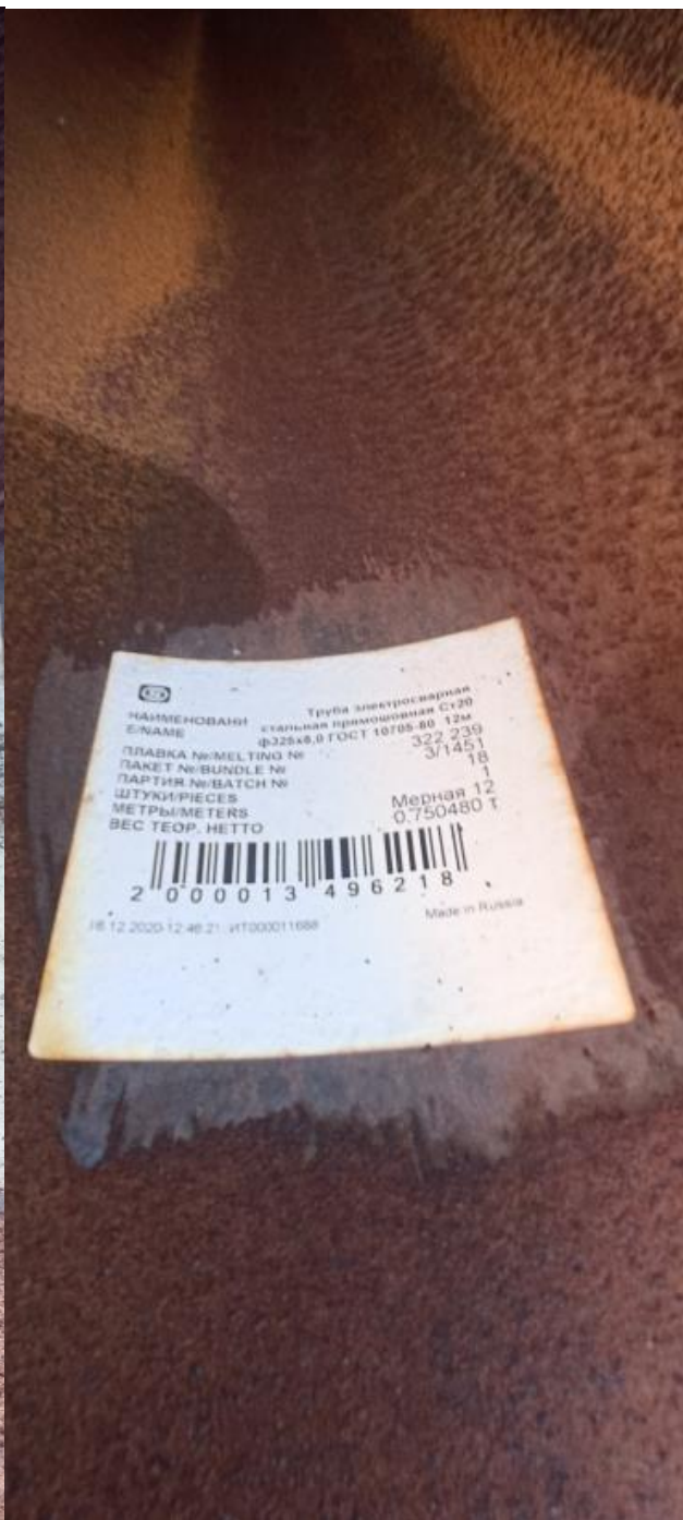
Труба 325*8*12000-МД ГОСТ 10704-91-20 ГОСТ 10705-80 (ТЭМПО)- 13.5т