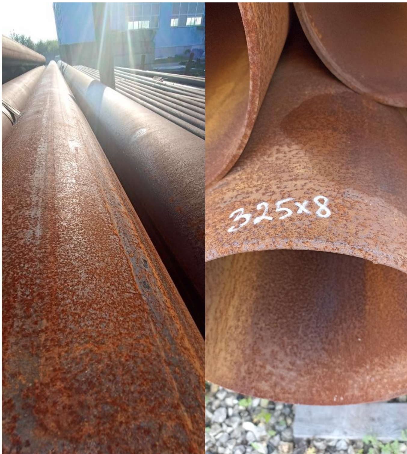
Труба 325*8*12000-МД ГОСТ 10704-91-20 ГОСТ 10705-80 (ТЭМПО)- 13.5т